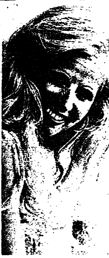
صباح : هل هي منافسة جيدة ؟

«قصيدة اخرى الى ميرا اليهودية» شعر : غسان الحاج يحيى يقول العقل أسرتي يئست ، سئمت من هذا الغرام الفج - لو عادت ساطردها يجيب القلب : لو عادت .. ساقف من حنايا الجرح ... ثم اطيروا لآري انام هناك عبر خلية العشاق ... عند السبل الحزري يقول العقل : أه يا هوى (ميرا اليهودية) ترى ستعود من يدي ؟ انسا الشناقق للالهامان من صفري يجيب القلب : لا تسأل ، غدا ستعود !! ميرا اسم تزل تشناقق يا - غسان - لقد حانت مواعيد المواسم في - رسي الطيره غدا نشدو مما احلى اغانينا وتعالي وانظري العشاق ما بهمو وقولي - الحاقدين اليوم - اينهمو لقد غاروا بعيدا منذ طورا السيره فيا ميرا - انا أت برغم الكسح - فلا الاحقاد تشنبا ، ولا الاديان ما كانت لتقصينا لانا يا - رفاق الحرب - عشاق ... لانا بن بنسي الانسان - حقا امانينا . الحز : ميرا - الاسم الاصل لبيدة ، دخلت قلب صاحب هذه الابيات ، بسون استقان ، منقط منه جمال الدهشة ، وزرعت فيه دلال الحيرة والاحزان .